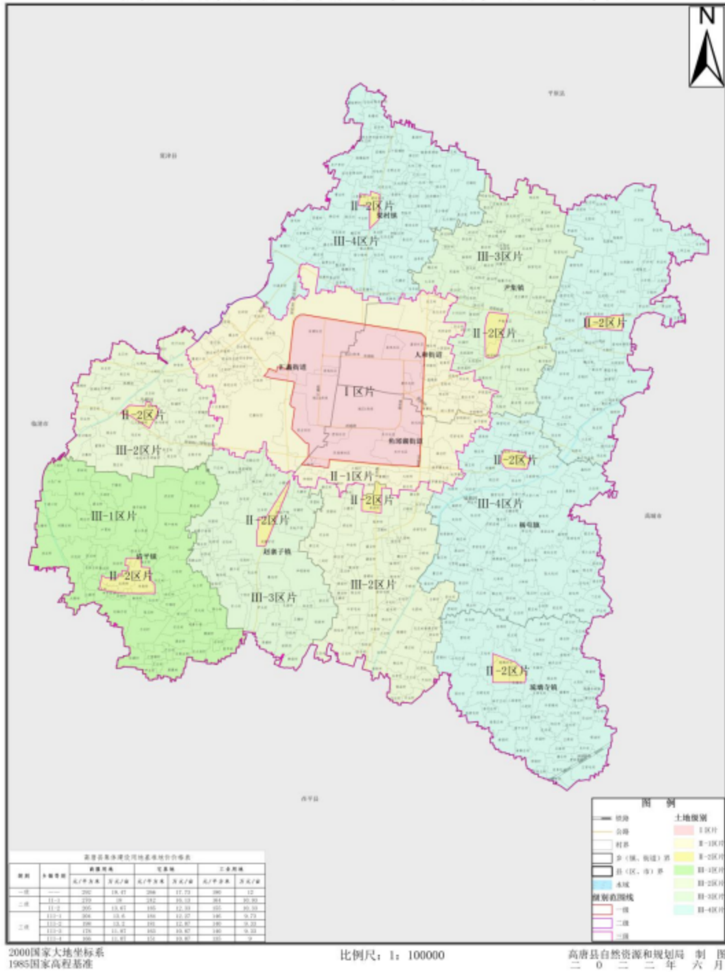
高唐县集体建设用地综合级别基准地价图